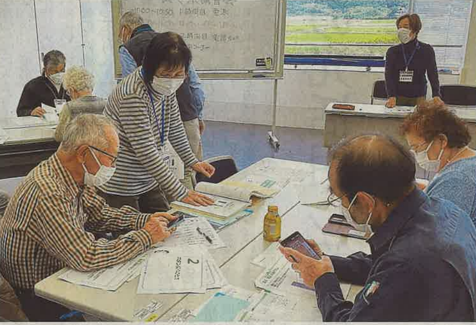
高齢者が同世代にスマホの使い方を指導する講座 = 2022年11月、袋井市のメロープラザ